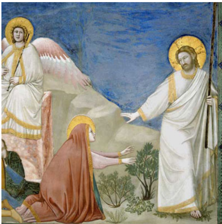
Cappella degli Scrovegni a Padova

“Il Signore è davvero Risorto, Alleluia. A lui la Gloria e Potenza nei Secoli Eterni.”